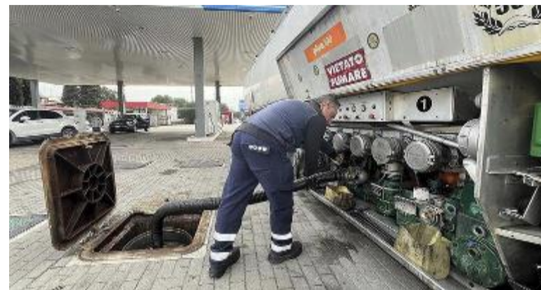
Carburante alle stelle: in aumento diesel e benzina