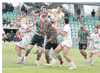
Pareggio tra Ternana e Perugia

► Al Liberati i rossoverdi si fanno rimontare due reti nel secondo tempo (2-2)